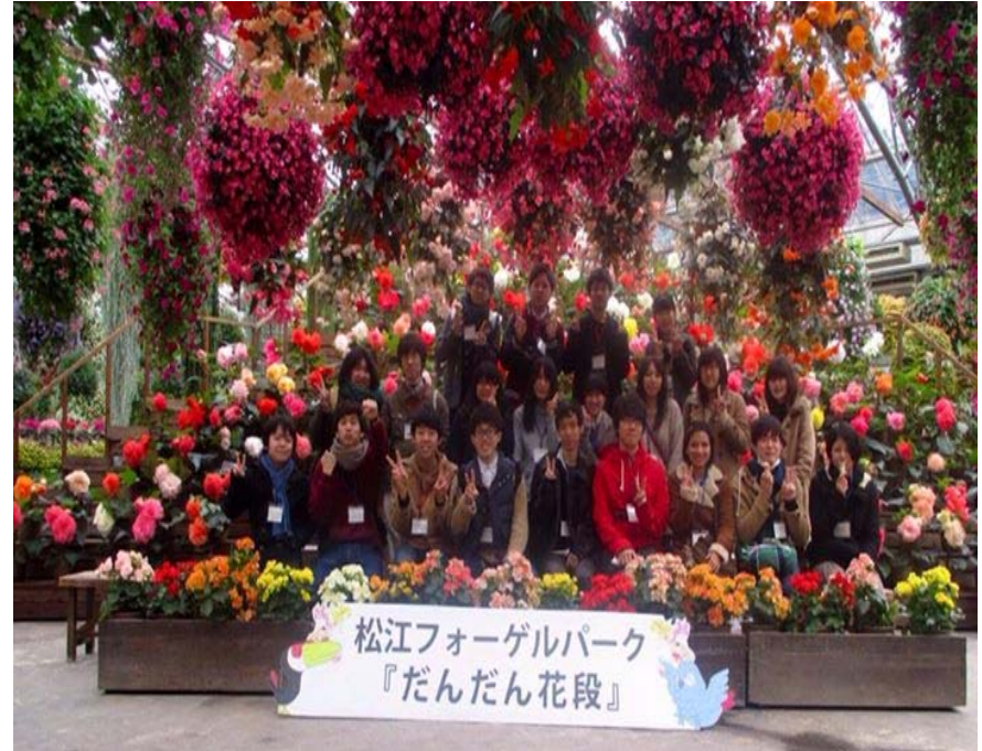
フォーゲルパーク